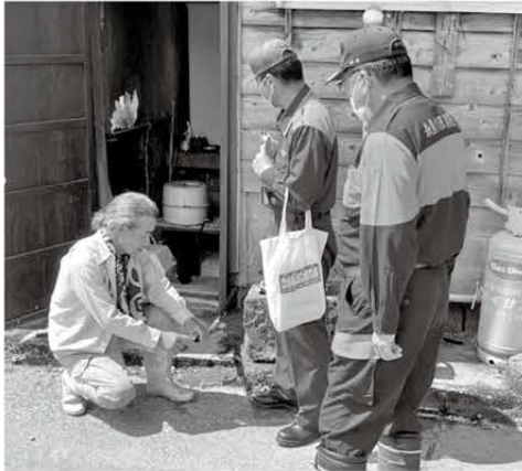
家庭で使用している天然ガスを確認中

3年ぶりに市内全域を対象とした防災訓練が行われました。能生体育館では、能生地区町内会の方が参加し、避難所設営訓練等を行い、段ボールベッドやパーテーション、簡易ベッドなどの組み立てを体験しました。また、富士通Japan株式会社によるスマートフォンを使った避難所受付システムのデモンストレーションも行われました。