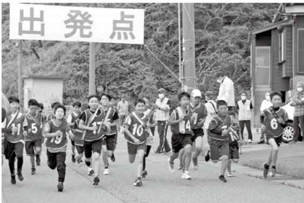
スタートをきる小学生