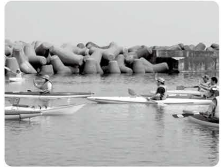
カヤックを漕いで、弁天岩を一周しました