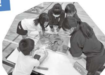
制作中の様子... 真剣です!