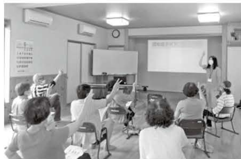
おおよそ20団体から申し込みがあるフレイル予防教室

「フレイル状態*」に早めに気づき、健康でいきいきと生活できるように「予防教室」を行っています。「栄養」「歯の健康」など、さらに「フレイル予防の極意」を学べる教室も開催中。