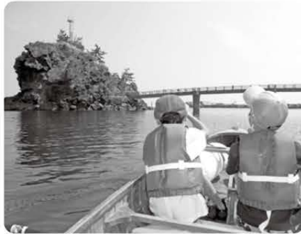
ボートの上から見る弁天岩はいつもと違う?!