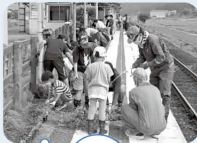
たくさんの雑草を 抜き取りました