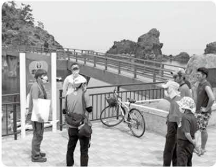
弁天岩の成り立ちを陸からも学びました

6月18日(土)、19日(日)に、B&G能生海洋クラブの皆さんにご協力いただき、弁天浜でカヤックとボートの体験会を開催しました。弁天岩の成り立ちなどをいつもとは違う角度から学び、海の魅力を体感しました。