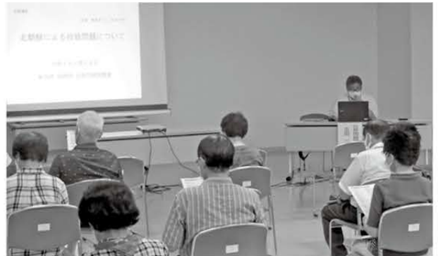
拉致問題の概要や取組の説明、アニメ「めぐみ」の上映を行いました

あわせて巡回パネル展も開催中です。近くにお出かけの際はお立ち寄りいただき、一緒に拉致問題について考えませんか。