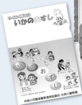
防犯クリアファイル