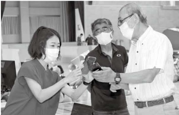
スマートフォンを使った受付システムを体験

3年ぶりに市内全域を対象とした防災訓練が行われました。能生体育館では、能生地区町内会の方が参加し、避難所設営訓練等を行い、段ボールベッドやパーテーション、簡易ベッドなどの組み立てを体験しました。また、富士通Japan株式会社によるスマートフォンを使った避難所受付システムのデモンストレーションも行われました。