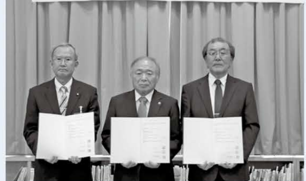
写真左から靄本教育長、米田市長、家崎会長