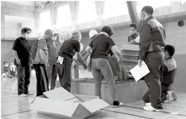
段ボールベッドを協力して組み立てます