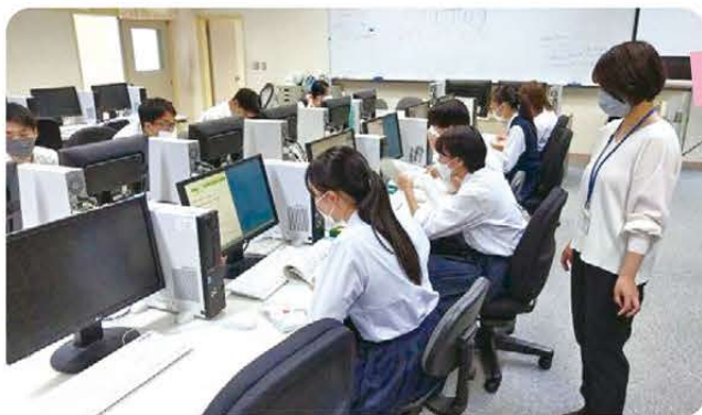
6月14日(火)から総合型選抜入試講座第1回目を実施しました!全8回の講座を計画しています。